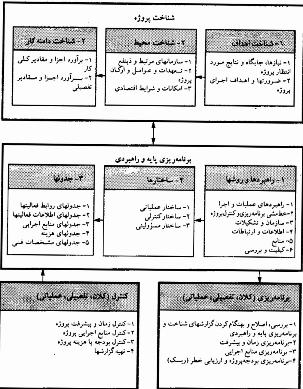
شکل شماره ۱- نمودار کلی نظام جامع برنامه‌ریزی و کنترل پروژه